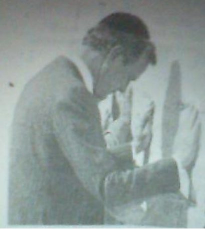
Baba Bush İsrail'deki ağlama duvarında