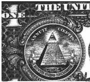
Dolar üzerindeki Siyonist işaretler